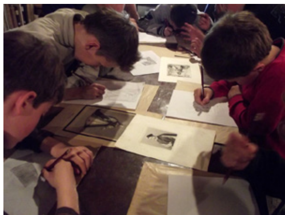
Atelier sur la gravure réalisé au musée lors d'une journée « Vive les vacances ! »