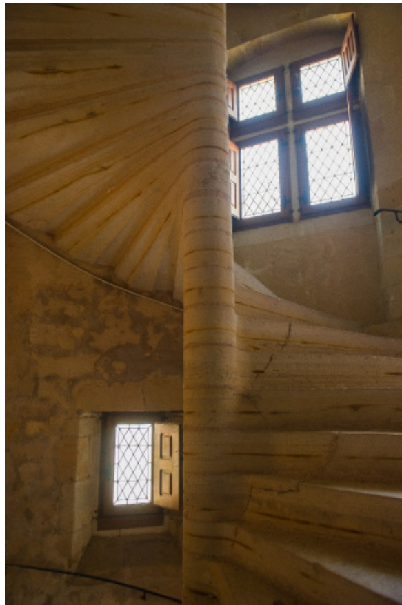
Escalier à vis classé Monument Historique menant au musée